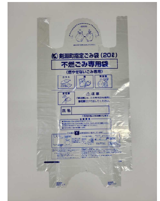
不燃ごみ専用袋 (有料)