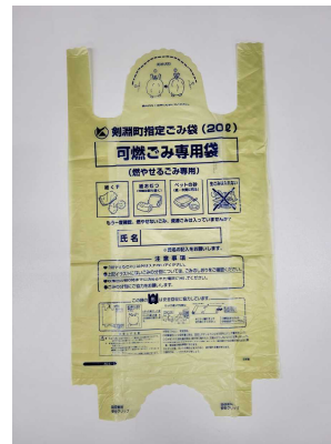
可燃ごみ専用袋 (有料)