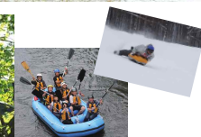
川下り&エアボード