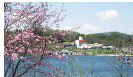
剣淵温泉レークサイド桜岡

春は桜、秋は紅葉と四季折々の景色を観ることができる公園。夏はキャンプ、サイクリング、パークゴルフ、カヌー、冬はワカサギ釣りや野外活動を楽しむことができます。