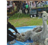
アルパカの毛刈りショー