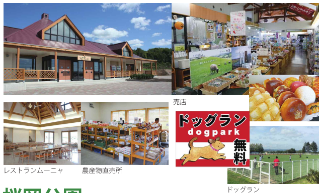
レストランムーニャ 農産物直売所

北海道上川郡剣淵町東町 2420 TEL 0165-34-3811 営業時間 9:00 ~ 18:00 (11月 ~ 4月は 9:00 ~ 17:00) *年中無休