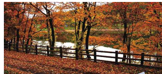
ムーニャの散歩道