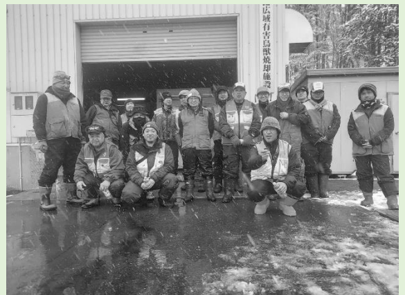
【剣淵・和寒猟友会合同エゾシカの一斉捕獲】

昨年は、熊のニュースが多くメディアに取り上げられていましたが、今年の被害をできる限りなくせるようにこれからも研鑽を積んで行きたいと思っています。