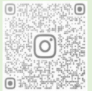
お食事処 さわらび