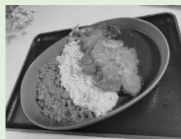
スペシャルカレー