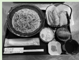
キヌア天ぷらそば