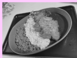
スペシャルカレー