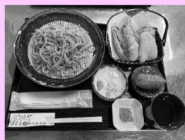
キヌア天ぷらそば