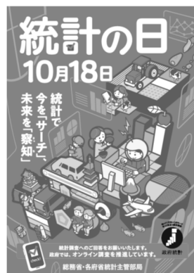
【令和7年度「統計の日」ポスター】 特選作品が活用されています。

toukeinohi_atmark_soumu.go.jp ※「atmark」を「@」に置き換えてください。