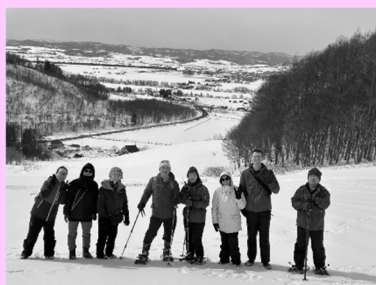
昨年のスノーシュー散策の様子

ですが、3月1日にアルパカ牧場とのコラボイベント、牧場内のスノーシュー散策は開催を予定しています。詳細は後日発表しますが、雪山散策とジプフィー滑りにご興味ある方は、インスタグラムでお知らせいたしますのでお申し込みいただけたら嬉しいです。