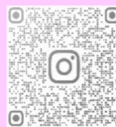
協力隊活動ページ