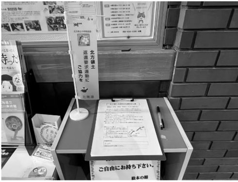
▲設置した北方領土署名コーナー