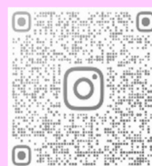
お食事処 さわらび