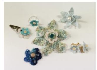
てとての創作活動