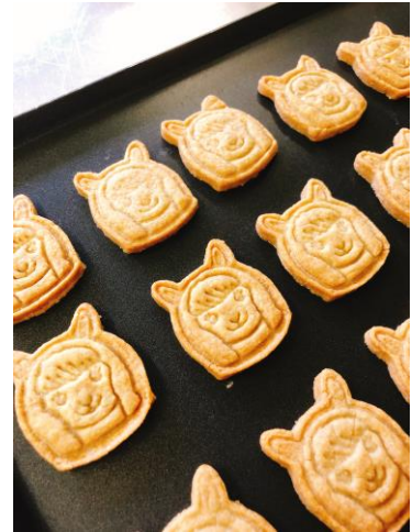
ぷっちょな型のクッキーを焼いてみました。

協力隊になると様々な研修に参加させていただく機会も多く、先日は札幌駅構内にあるどさんこプラザに行って販売実習をしました。道内各地の特産品が集まり、観光客にも地元の方にも親しまれているお店です。どんな商品が売れているか傾向を見てみると、「健康志向」「少量・使い切り」などの特徴を兼ねているものが人気でした。また道内産の特産品であれば、期間限定でテスト販売していただける制度もあるらしく、野菜クッキーも置いてみたいと考えています。