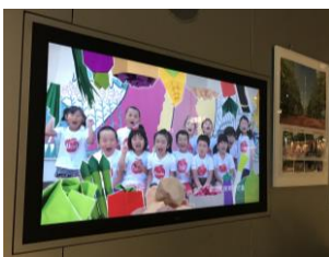
剣淵農業プロモーション動画