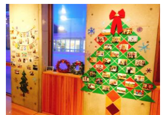
クリスマス写真展