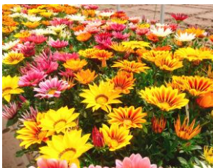
剣淵高校の満開のお花

2017 年度も終わり、協力隊の活動報告会も無事開催できました。ご来場いただいた皆さま、ありがとうございました。さて、協力隊の活動や剣淵ならではの美しい風景を写真で振り返ります。