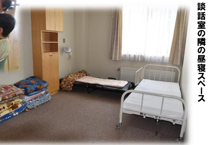
談話室の隣の昼寝スペース

した。 剣淵町でデイサービスを行っている事業所はりんどうのほかにも デイサービスセンター剣淵ひらな み荘があります。 最近体が動かなくなってきた、 同年代の人と交流を図りたいとお 考えの方はぜひご利用を検討され てみてはいかがでしょうか。 りんどうを利用するにあたって 申し込み方法などは、地域包括支 援センター（健康センター内）に 相談してください。