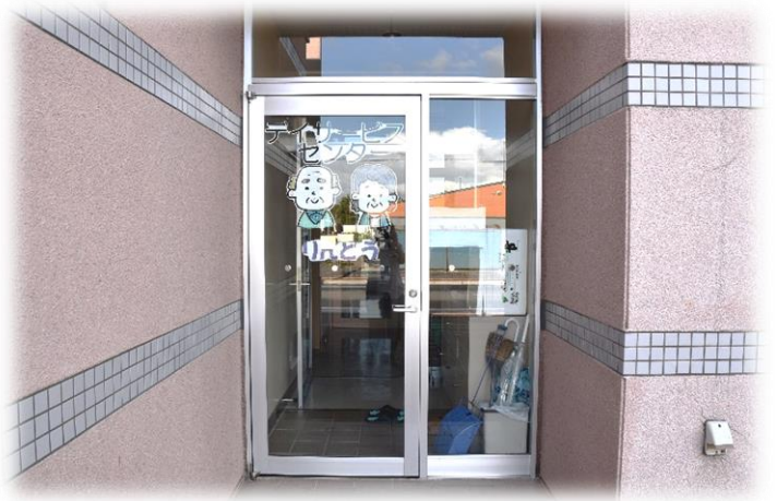
手づくりの看板が目印の玄関