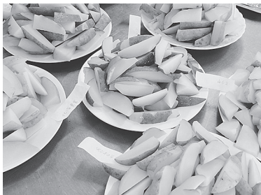
試食会にて。9種のジャガイモを食べ比べていただきました。

先月号の広報にも書きましたが、じゃがいもを使ったご当地グルメを！と意気込み、早速フライドポテトを作り始めました。これが…難航しております…。「切って揚げるだけ。」だと思いきや、調べるとポテトの調理法は幾通りも。油温度、揚げ時間、油に対するポテトの量、カットの仕方などなど、それだけコツがいくつもあるようです。初めて作ったものは『べちゃっとしなしな』に。外はカリッと中はホクホクという理想のポテト像には程遠い仕上り。失敗作が続き、なかなかうまくいきません。