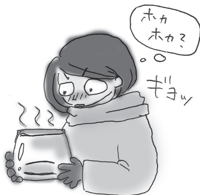
湯気が立っているかのような マイナス30度の時のアイスクャンドル

3月は地域おこし協力隊の活動報告会を開催します。現時点で私はまだ準備の初期段階で、英語で言うならばノープラン状態です。(計画立っておりません。)貴重なお時間をいただいているので、できればご参加いただく皆さんが聞きたいと思うことを報告なり発表なりできれば…とは思っています。が、それが何なのかよく分からず、時だけが無情に過ぎてゆきます。