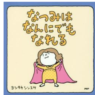
『なつみはなんにでもなれる』