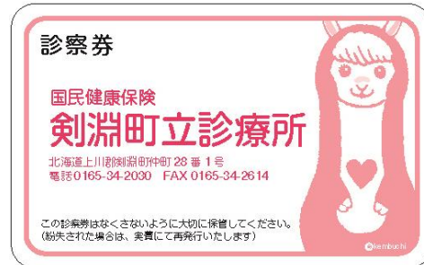
← 診察券 (表面)