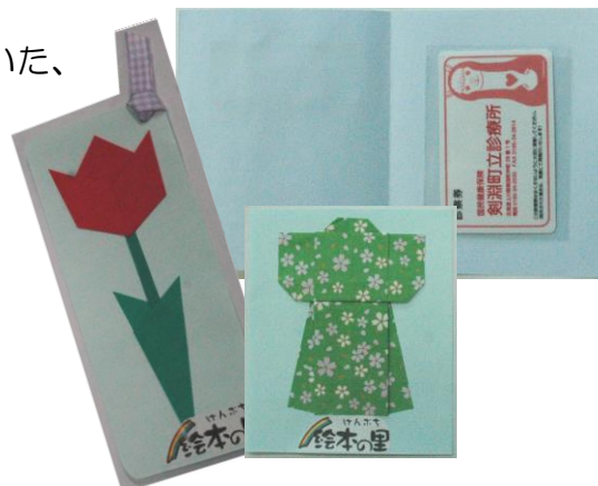
← 寄贈いただいたしおりや台紙