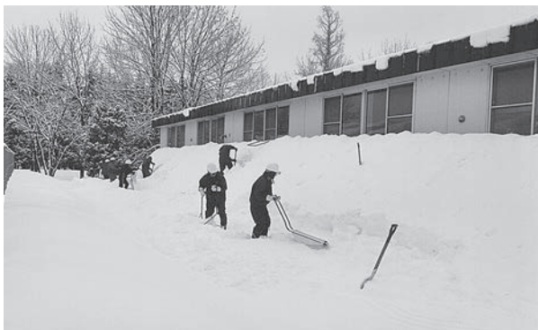
高齢者事業団による公共施設の除雪作業

剣淵町高齢者事業団は『高齢のため一般雇用になじまない、またはそれを望まないが働く意欲を持っている、健康な高齢者が地域社会の活動を綿密な連携を保ちながら、その経験・能力・希望を活かし、相互の協力のもとに就業機会を確保し、生活の充実・福祉の増進を図るとともに、地域社会づくりに寄与する』事を目的に、設立準備委員会を経て、平成元年4月に剣淵町と社会福祉協議会の補助