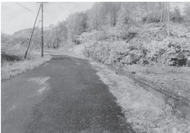
町道西4号（南桜町、下水道汚泥堆肥場道路）完成