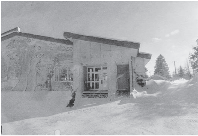
防犯対策が望まれる常設保育所