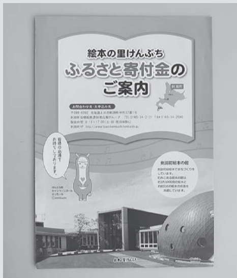
今後も期待されるふるさと寄付金

また、寄付者に返礼品を送るふるさと納税の開始、地方創生加速化交付金を獲得しての積極的な事業展開等、先を見据えた新たな取り組みが始まった事で近年の厳しい財政事情の中、町独自の財源獲得の可能性が生まれた事は大変評価できるものであり今後の成長が期待されます。しかしこれらの事業が継続して成長していくためには、常に事業を検証、精査し、スピード感を持って取り組まなければなりません。また今後も各建物の老朽化による改修が望まれる箇所もあつたり、国の制度が頻繁に変わる等難しい行政判断を迫られる事が予想されますが、限られた予算で最大の効果が出るよう期待します。