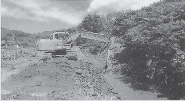
刈分川災害復旧工事のようす