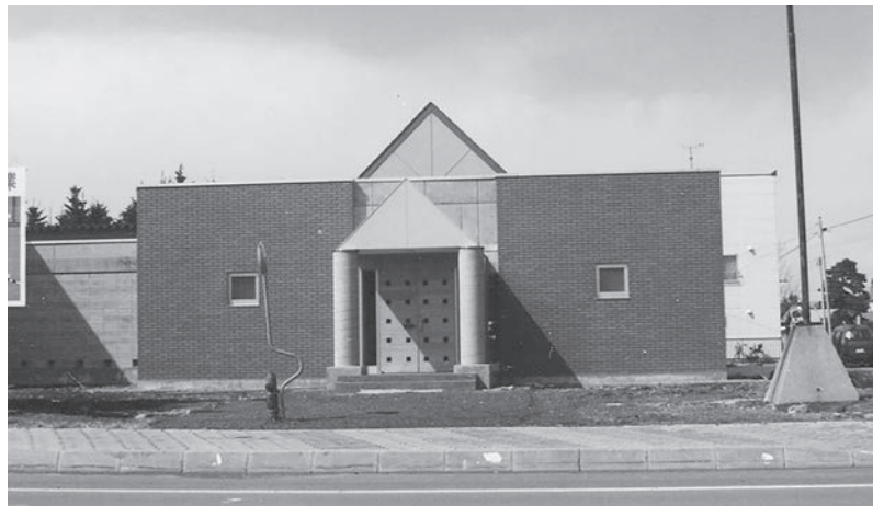
絵本の収蔵館前広場の活用は

原画収蔵館周辺は現在のところ、特別建物を建てるなどの構想はない。旧絵本の館跡地の現状として、冬場の雪集積地や農協の会議などの時の駐車場として利用されている。