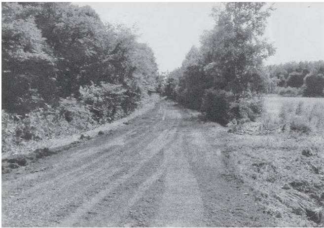
町道1線（南桜町、西岡町境界付近）完成

11月14日現在で80%を超える復旧状況であり、地元関係者の協力や地元建設会社、所管課の対応に敬意を表する所である。しかし、未復旧の箇所がまだ20%近くあることから、今後の降雪等を考慮し、これからの復旧に向けて、特に地元住民との連絡を密にして進めてもらいたい。近年想像を超える災害が各地で多発しており、本町においても今年の災害を教訓に今回特に被害の甚大な箇所を重点に万全に備えて日頃の見回り点検を強く望みます。