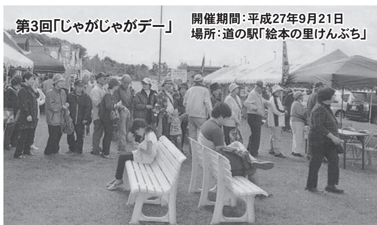
第3回「じゃがじゃがデー」