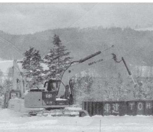
冬 暗きよの作業風景

資材の高騰もあり次年度に向けて改定する必要があると思うので所管課とも協議していきたい。又先程の交付金の減額に関しては私も非常に憤りを覚えており農水省に出向いた機会に政策担当者につきり話をしてみたい。