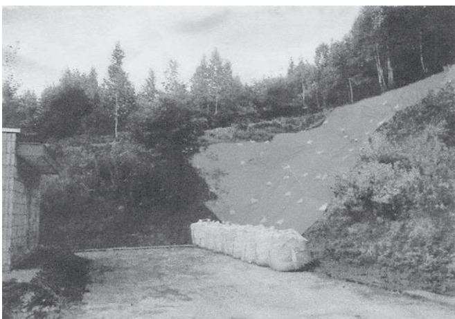
西岡配水池法面滑落補修 完成