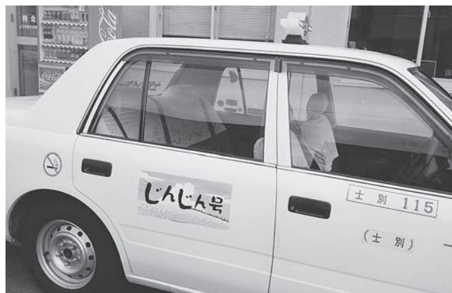
乗り合いタクシーじんじん号

自主返納者に町として記念品を贈ることは難しい判断をしなければならぬ。しかし、何らかの特典を微々たるかたちで考えてみたい。