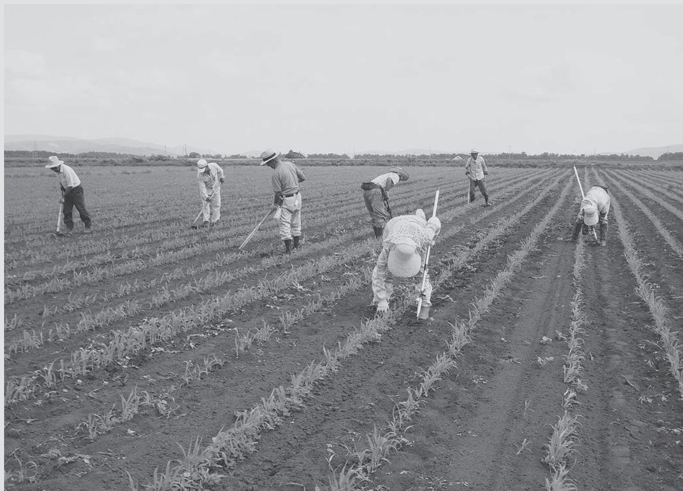
高齢者事業団による農作業のようす