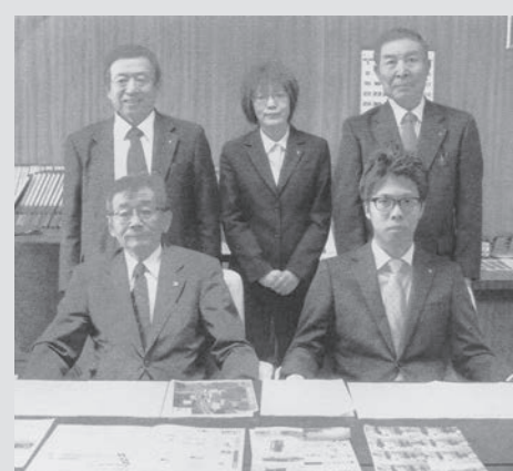
広報委員のメンバー