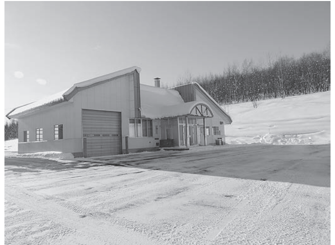
最終処分場事務所