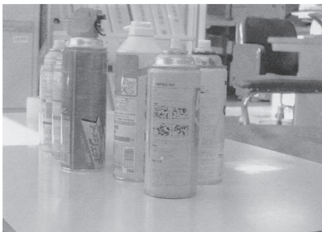
現在穴を開けて処理しているボンベ類