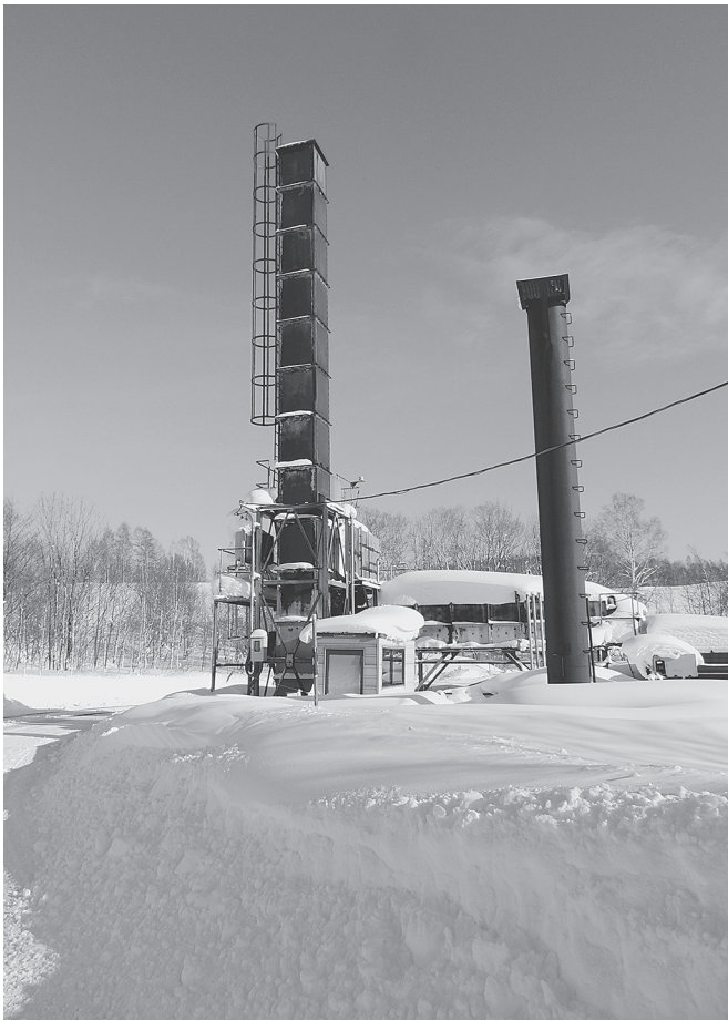
解体が望まれる旧焼却炉

望まれる。また当町は人口減少傾向にあるがごみの量はそれに比例して減少していないため、次の第2埋立て方式のコスト等を対比し将来を見据えた安定的な処理を検討していくべきである。また、以前使用していた焼却炉についてはダイオキシンの飛散など環境への影響も懸念されることから早期の解体を望むところである。