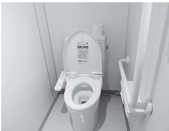
中学校3階トイレの洋式化とバリアフリー化された男子便所