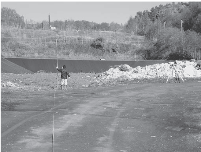
埋立て可能年数測量