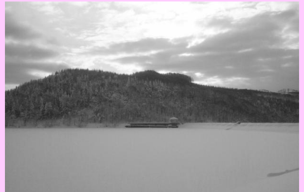
凍った桜岡湖。ワカサギ解禁です