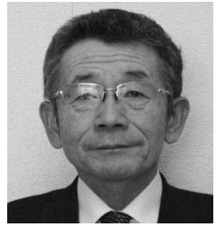
高橋 一博 議員 (60 歳)