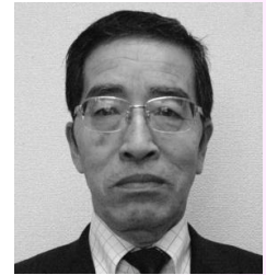
卯城 規伊 議員 (60歳)