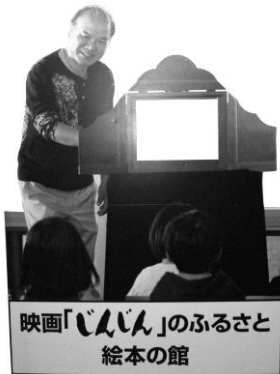
映画「じんじん」のふるさと 絵本の館

▲絵本の館に設置しています。紙芝居の枠に、紙芝居をはめて読み聞かせの雰囲気を楽しんでみてはどうでしょうか。