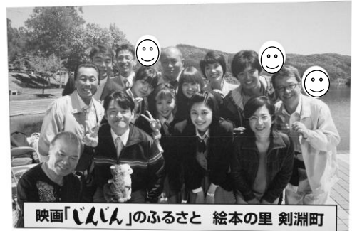
映画「じんじん」のふるさと 絵本の里 剣淵町

絵本の館と道の駅に顔出しパネルが設置されました。顔等をはめて写真を撮影すると映画出演者と共演した気分を味わえます。