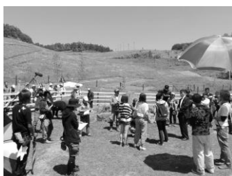
▲多くの方にご協力をいただいた映画撮影