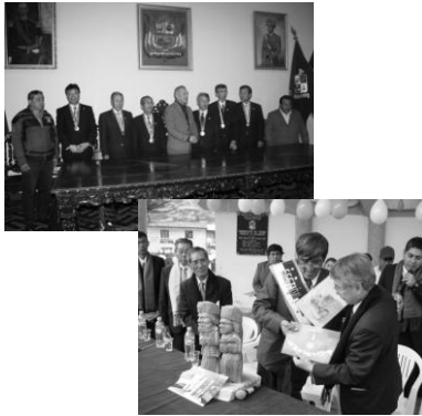
▲(左)タルマ市訪問 (右)パルカマヨ区訪問の様子

A 昨年のペルー訪問では、姉妹都市であるパルカマヨ区と交流を行い、隣接するタルマ市から姉妹都市提携を要望され、現在、大使館を通じて協議中です。