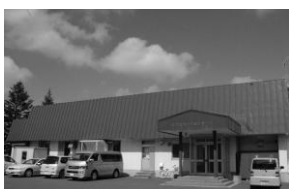
▲地場産の食材を使ったおいしい給食を提供している給食センター

A 各学校の児童生徒並びに先生方からは「とてもおいしい」との評価を頂いておりますが、もし近隣市町村に給食を委託すると冷えた給食となることが考えられるため、今のところ剣淵町で給食を提供し続ける方向で考えています。