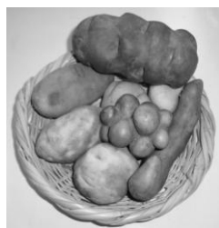
▲さまざまな種類のペルー産じゃがいも

A じゃがいもについては、じゃがいもがんにしゅ病、ジャガイモシストセンチュウの侵入を防ぐため、これら病害虫の発生している国（ペルー等）からは輸入が禁止されています。また、輸入が可能な国からのじゃがいもであっても、輸入時の検査に加え、隔離栽培（国の施設で、輸入したじゃがいもを植えてウイルス病等の検査を行う）が必要になります。