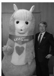
▲今後活躍が期待されるぶっちゃん

A 町でイラストを作成し、それを利用してグッズ製作をしていただきたいと思います。