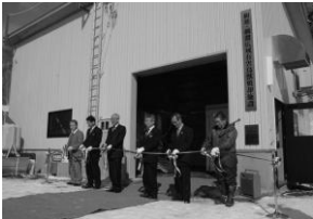
▲和寒・剣淵広域有害鳥獣焼却施設オープニングセレモニーの様子