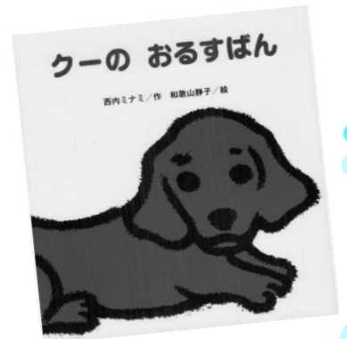
『クーのおるすばん』