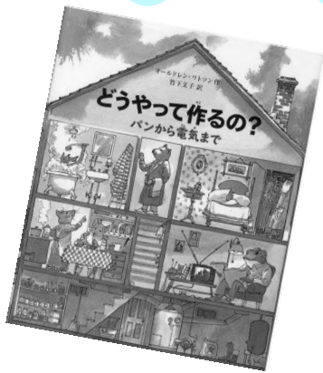
『どうやってつくるの?』