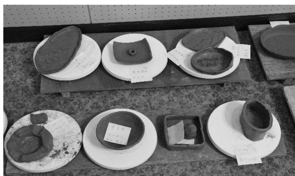
「けんぶち粘土で陶芸教室」にチャレンジ！