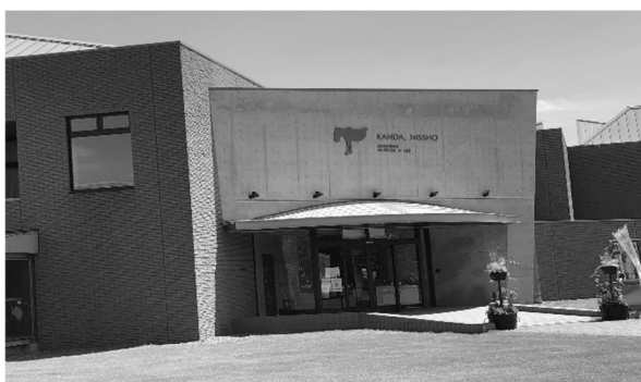
社会見学（鹿追町 神田日勝記念美術館）