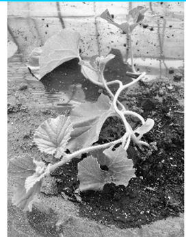
メロン(北かれん)小づるが伸びてきました

ハウス栽培と並行し、今年も保育所横の畑を使わせていただきます。豆を播こうと畑に行ってみたところ、どなたかはわかりませんが、畑の周りの草をきれいに刈ってくださっていました! この場をお借りしてお礼を言いたいと思います。すごく助かりました。ありがとうございました!!