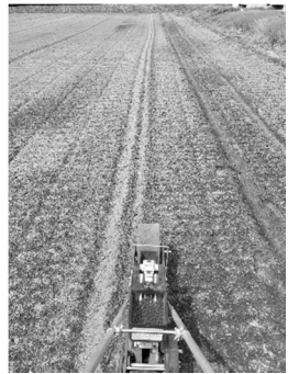
道具をお借りして大豆(エダマメ用も)をまきました。