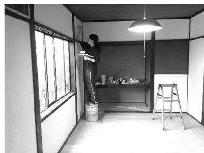
壁に漆喰を塗っています