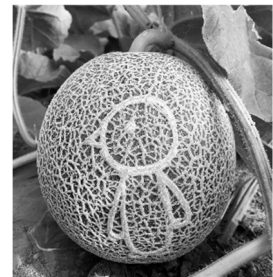
小さいうちに絵を描き、ペンギンメロンを育てています。

「おいしい通販」では8月上旬にロイシーコーンを販売しました。頼んでもいないのに、古くからの友人たちが買ってくれました。「友人が頑張っている剣淵町のサイトでロイシーコーンの販売を見つけた時は、迷わずポチッとしてしまった。」そうです。10本あっという間になくなってしまったとか。剣淵を知り、味わってもらえたのがとても嬉しかったです。