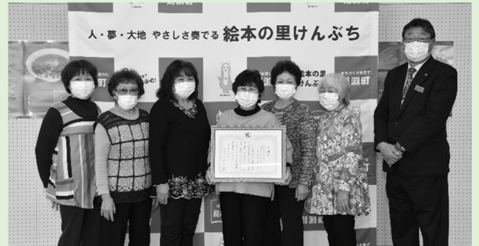
J A 女性部剣淵支部ほほえみグループ