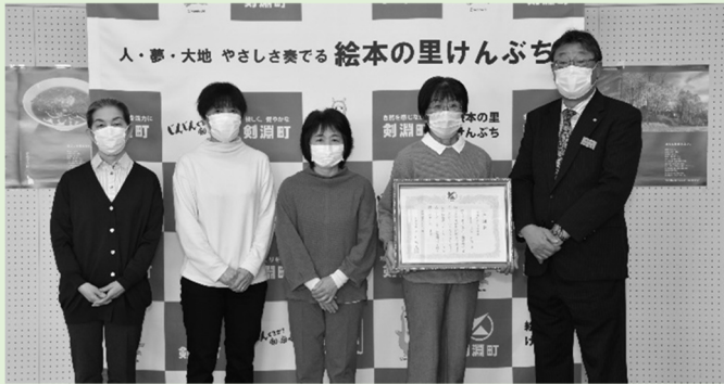
剣淵町赤十字奉仕団