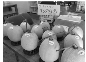
メロン販売もありがとうございました！