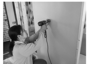
トイレの壁をつける作業

開業に向けた本格的なスタートはこれからです。作業の進捗状況もまたお伝えしていきます。