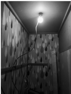
押し入れがトイレに

プロジェクトの終了まで支援者がどなたなのかわからなかったのですが、蓋を開けてみると町内の方もたくさんいらっしゃいました。個人的に手渡しして下さった方も多く、嬉しさもちろんですが、ずっしりとした重みも感じています。