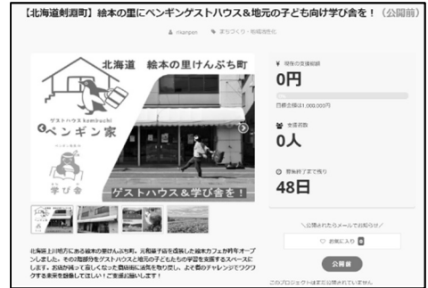
サイトHP (現在公開中です)

期間は8月31日まで。「クラウドファンディングなんてやり方がわからない」という方には、ノールに募金箱を設置しておりますので、よろしければそちらにご支援お願いします。