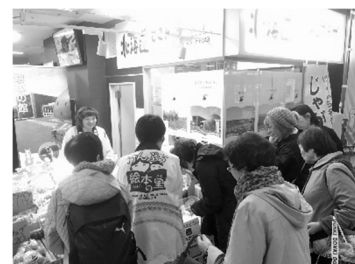
どさんこプラザでの催事の様子。まさに飛ぶように売っていました。

上川管内の協力隊研修会で東川町に行ってきました。剣淵に来る前に住んでいたのが懐かしい気持ちになりましたが、東川はすごいスピードで変化しているなど改めて感じました。協力隊同士でさまざまな話もでき、とても充実した研修会となりました。