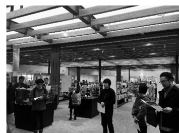
東川町せんとぴゅあでの研修会の様子