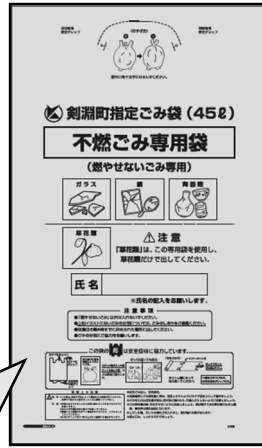
不燃ごみ専用袋 (有料)

不燃ごみとして、陶器類、ガラス、鏡、刃物、ビン・缶類のふた（内側にプラスチックなどがついているもの）などがあります。