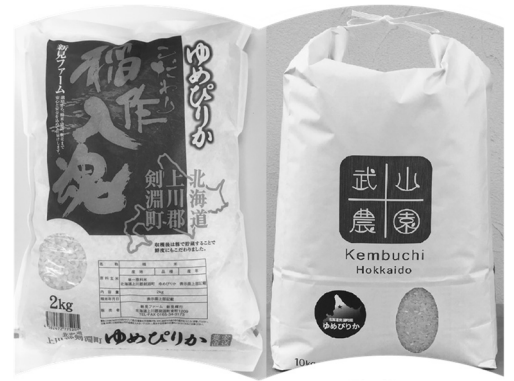
大人気のお米定期便（10万円コース）

現在町では、ふるさと納税の更なる増加を目指し、町の魅力発信、ブランド力の向上を図るため、新たな返礼品のご提案を募集します。事業者の皆様からのたくさんのご応募をお待ちしております。