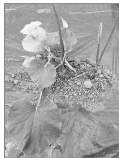
コンパニオンプランツでネギと一緒に植えてみました