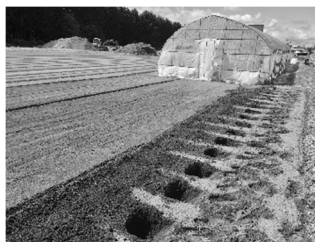
アスパラ用の穴を掘りました

今年もメロン定植が無事終わり、毎日朝夕、ハウスへと向かう生活が戻ってきました。そのプレッシャーで夜はあまり眠れないこともあります。3か月ほどで終わってしまうのでこの時間を楽しみたいと思います。そのメロンのお隣にはアスパラガスを植えさせていただきました。これまでさまざまな作物の栽培を経験してきましたが、やってみたいなあと思っていたのがアスパラガス。一度植えたら10年ほど収穫できるというのがとても不思議です。今植えて来年初収穫...ということです。来年の任期後も剣淵町でお世話になりたいと思っています。ゲストハウスへの整備も少しずつ、本当に少しずつですが進めています。進捗状況をまたお伝えしていきます。