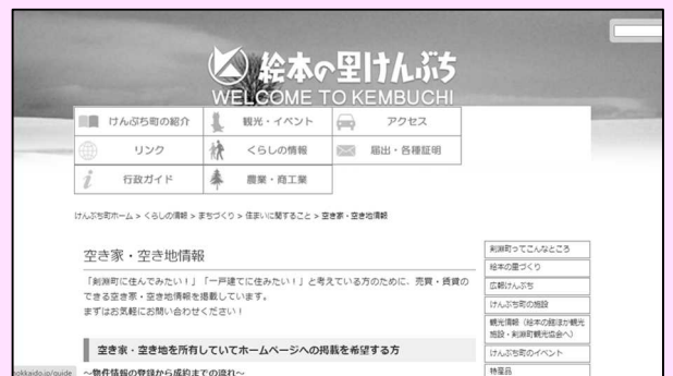
▲町ホームページ「空き家・空き地情報」

※町ホームページの「空き家情報」は、掲載するとすぐに問い合わせが来ている状況で、令和 3 年 12 月末現在の空き家登録は 0 件となっています。